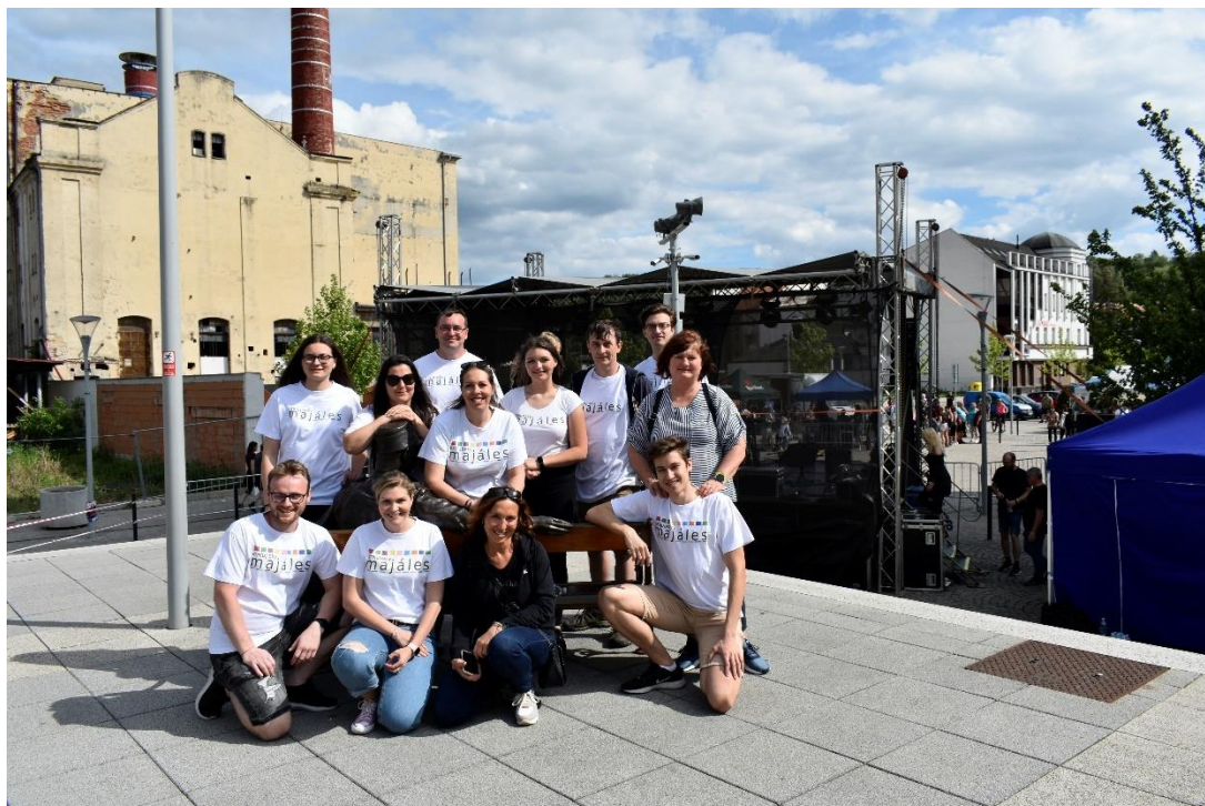
Survivor – Dny Kralup